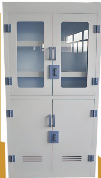
Gabinete de reactivos PP