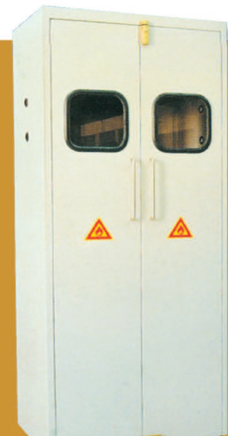
Todo el gabinete de cilindro de gas de acero