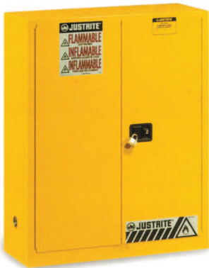
Armario de seguridad contra incendios líquido inflamable amarillo