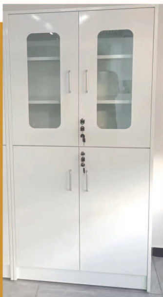
Todo el gabinete de reactivos de acero