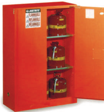
Gabinete de seguridad contra incendios líquido rojo combustible