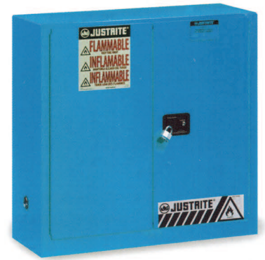
Gabinete de seguridad a prueba de ácido azul